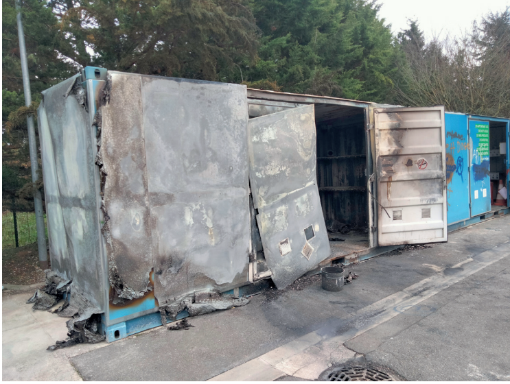
DECH BAILLY 1