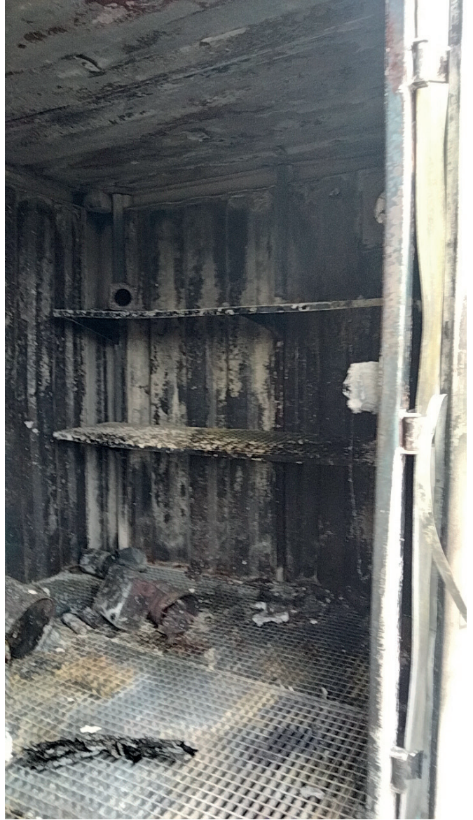
DECH BAILLY 2