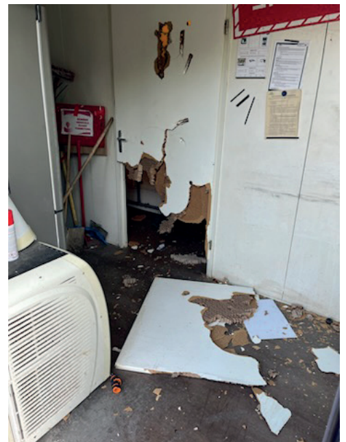
DECH COULOM 3