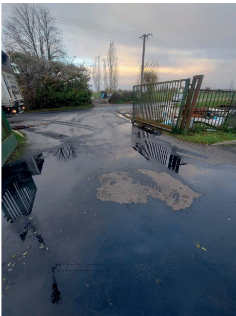
DECH COULOM 1