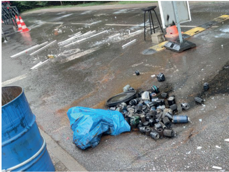
DECH BAILLY 3